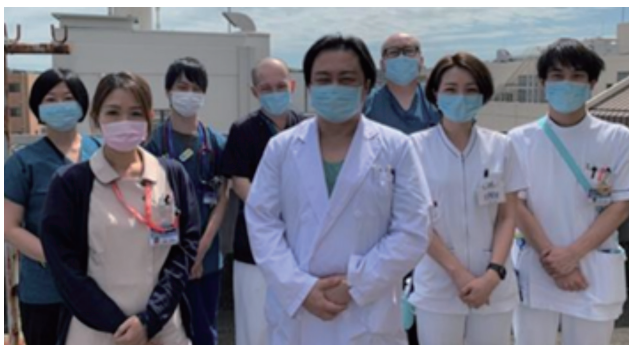
写真1:当院のPICC挿入チーム

神奈川県内の指定研修機関と協働で研修を行うなど、地域の連携強化にも取り組んでいます!